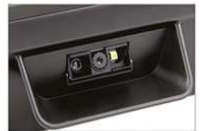
1D/2D barcode scanner